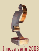
Innova saria 2008