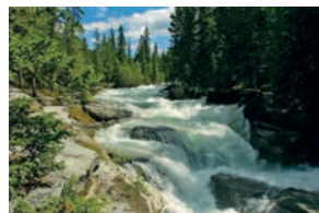
3. Unai Ormazabal Berasategi