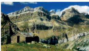
2. Agustin Gilabert