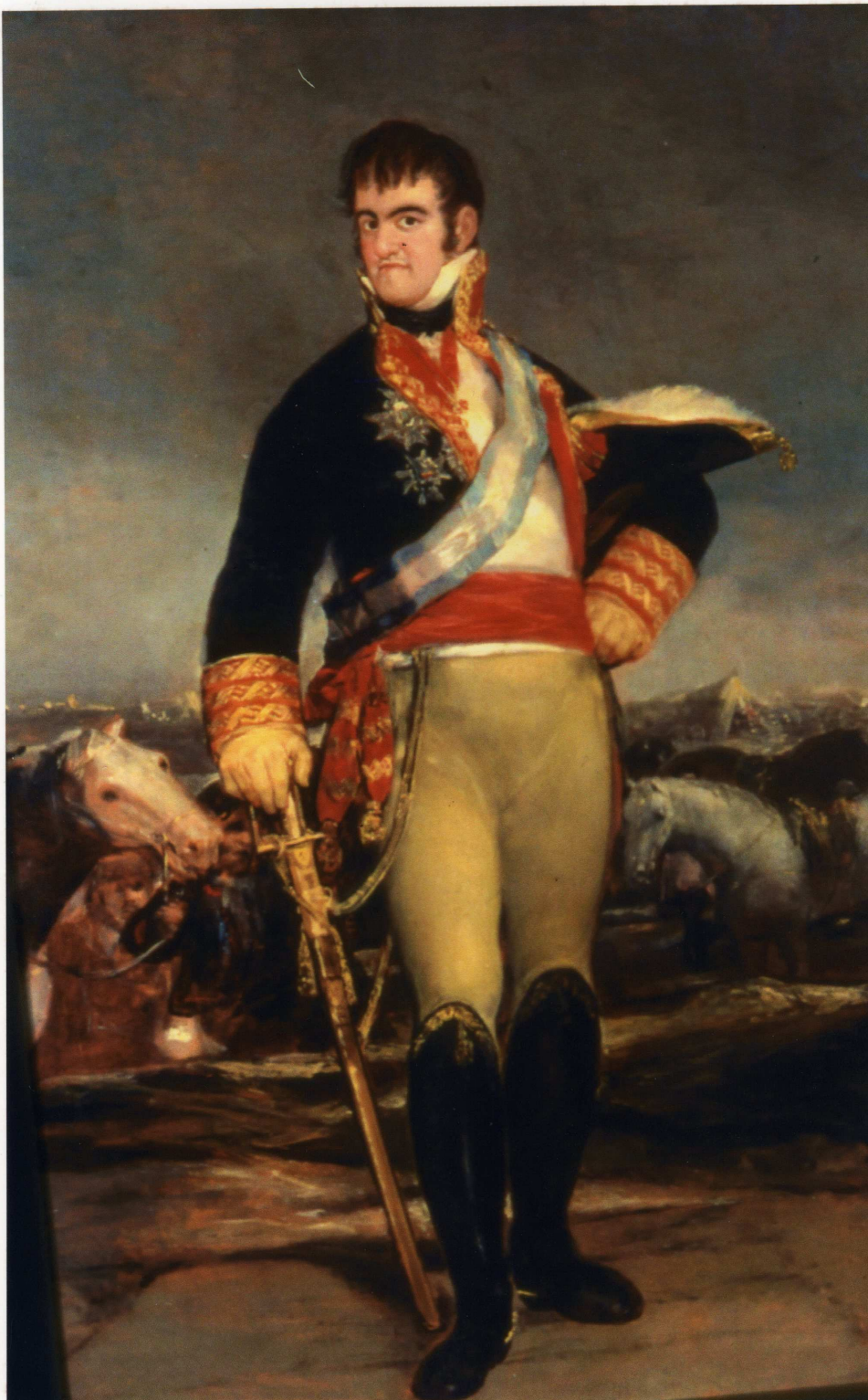
Fernando VII, por F. GOYA. Museo del Prado, Madrid. « Aquel por el que llegó la guerra »